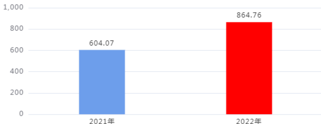
财政拨款支出对比图（单位：万元）

2022年度一般公共预算财政拨款支出年初预算694.63万元，支出决算864.76万元，完成年初预算的124.49%，占本年支出合计的100%。与上年相比，财政拨款支出增加260.69万元，增长43.16%，增长的主要原因是：工资结构调整，基本经费支出相应增加；新增执法综合监管平台升级项目，项目经费支出增加。