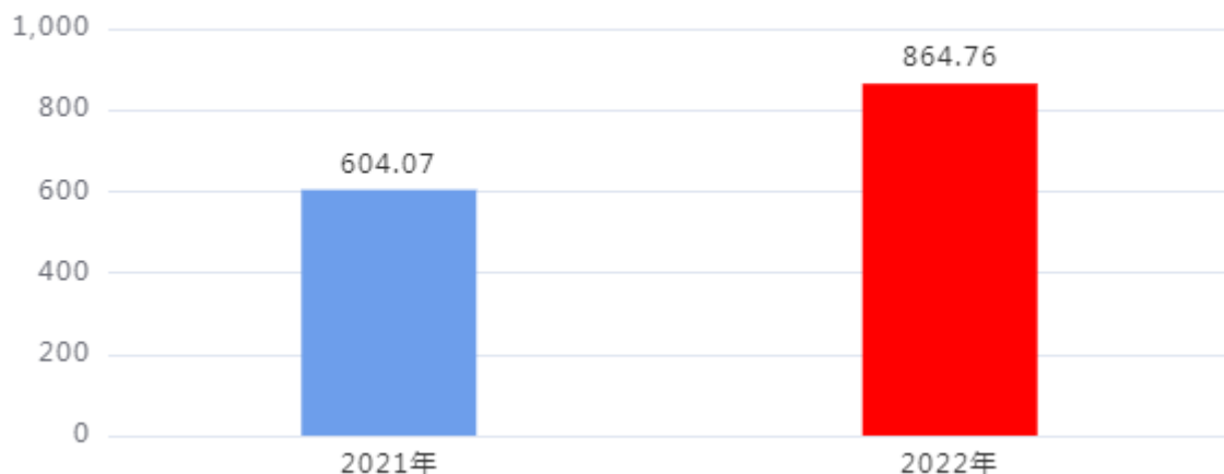
财政拨款收入、支出总计对比图（单位：万元）