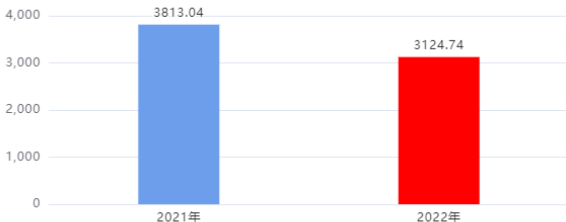
财政拨款收入、支出总计对比图 (单位: 万元)